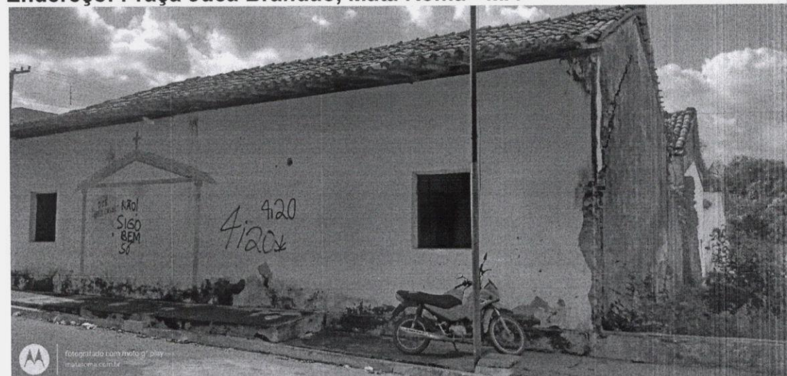
Endereço: Praça Juca Brandão, Mata Roma - MA