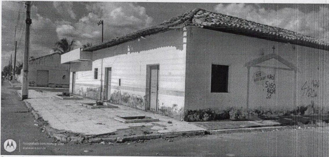
Avenida Eram Almeida, Centro, Mata Roma – MA.