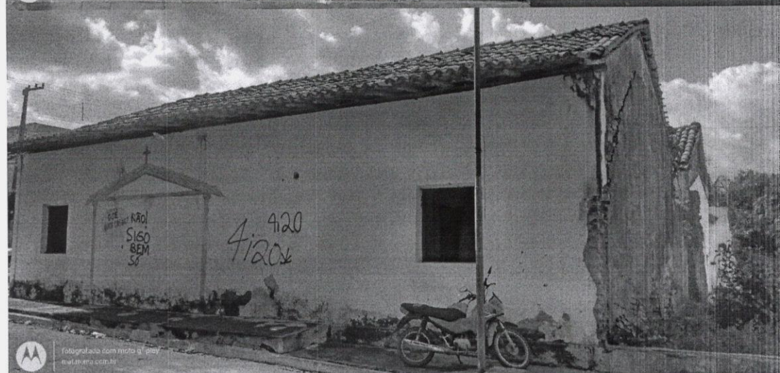
Endereço: Praça Juca Brandão, Mata Roma - MA